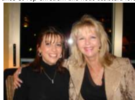
Deux belles représentantes de l'Europe du sud et du nord...

Soyez abondamment bénis, chers Amis, et recevez nos salutations amicales et fraternelles en LUI!