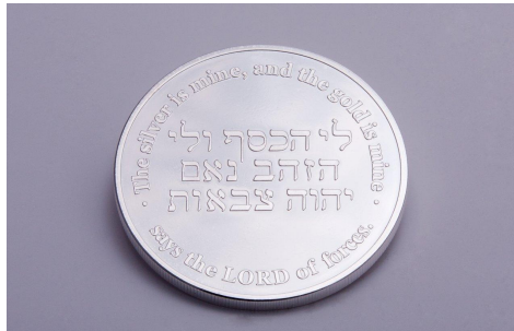
Médailles « Aggée 2:8 » d'une once en argent pure 31,1g - 999,5

rien à voir avec la multiplication qu'elles génèrent. Exactement comme c'est écrit dans Deutéronome 8 v.13. Le monde travaille avec des intérêts et la spéculation (parier, jouer, lotterie etc.) alors que le royaume de Dieu fonctionne avec la multiplication!